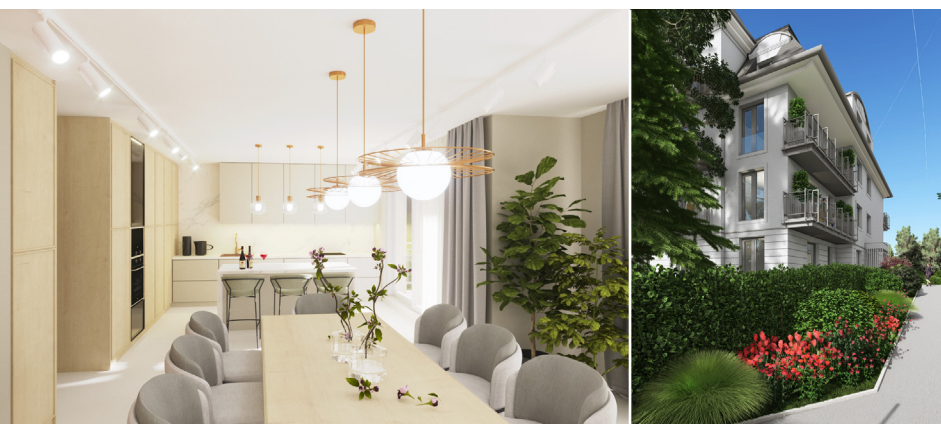
A projekt látványtervei