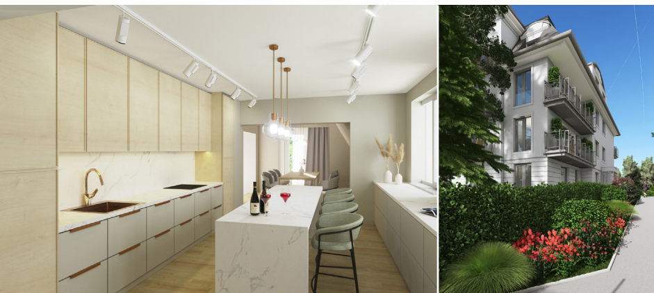
A projekt látványtervei